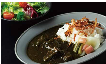
スパイシーポーク黒カレー 1350

ふわとろのオムレツに、 とろとろに煮込んだ牛肉のデミグラスソース。 アウェイク名物のオムライス。