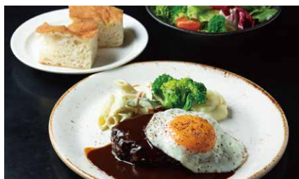
ハンバーグステーキランチ 1650

スパイスの効いた黒カレー。 じっくり煮込んだ香味野菜に、トロトロの豚肉。 お出汁のピクルスもアクセント。