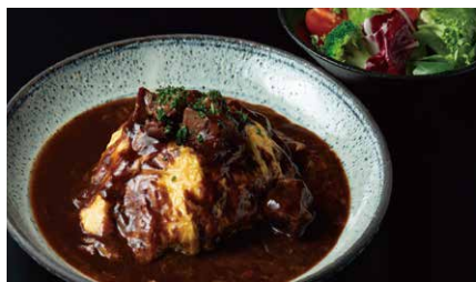
牛肉煮込みのオムライスランチ 1450