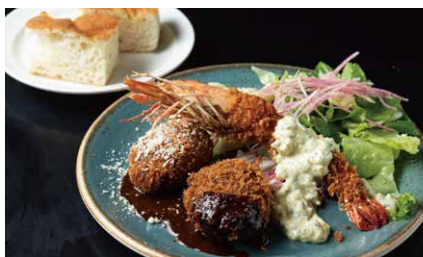
大海老ミックスフライランチ 1650

肉感のあるハンバーグに、 アウェイク特製のデミグラスソースをたっぷり。 目玉焼きをのせて。