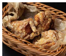
タンドリー チキンの唐揚げ 550